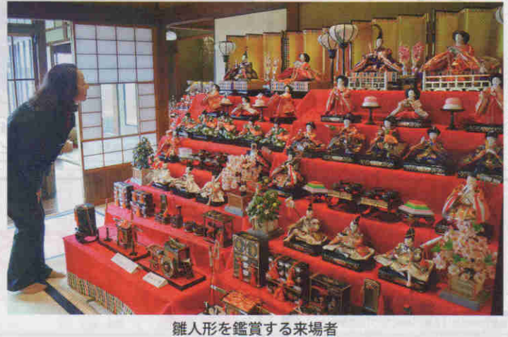
雛人形を鑑賞する来場者

不妊治療でやっと授かった赤ちゃんの流産や早産は、自然妊娠時よりも確率産で産める確率が高まりま 「自然妊娠で元気が赤ちゃんを産みたい。そう思っている方は、今から身体を整えることを考えてみませんか。身体づくりは妊娠してからでは遅いのです。『マイナス2歳の子育て』。男女と