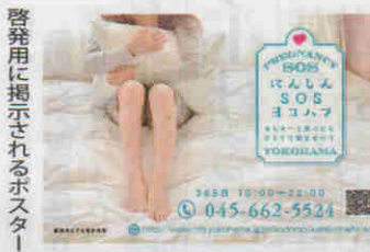
啓発用に掲示されるポスター

横浜市は妊娠や出産、育児などの悩みを電話やメールで相談できる窓口「にんしんSOSヨコハマ」をこのほど開設した。予期しない妊娠で悩む女性が、孤立することなく相談支援を受けられるようにするのが狙い。妊娠早期からの支援充実と児童虐待防止につなげたい考えだ。 にんしんSOSヨコハマは臨床経験5年以上の保健師や助産師、看護師などの相談員が妊娠や出産、育児に関する悩みを持つ相談者に365日対応する。必要に応じて、各区の福祉保健センターなどの相談支援機関を紹介するなどして継続的なサポートを目指す。 横浜市児童相談所での児童虐待の相談・通告受理件数は年々増加し、2014年度には4507件と過去最多となった。厚生労働省が昨年10月に発表した検証結果によると、心中以外の虐待死は0歳児が死亡事例全体の4割以上を占めている。また、妊婦健康診査の未受診や望まない妊娠であるケースも目立った。市こども青少年局こども家庭課によると、妊婦健康診査を受けず出産時に初めて医療機関を訪れる「飛び込み出産」は、市内でも年間約60件あるという。