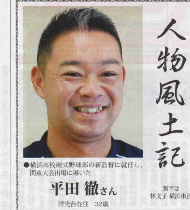
●横浜高校硬式野球部の新監督に就任し、関東大会出場に導いた

人生のエンディングを考 えることを通じて「今をよ りよく生きる」ための「終 活」でも、自分の終末の考 えをどうやって家族に伝え たいのか。また、親や伴 侶に「もしものときの希望 を、どうやって聞けばいい の?」と悩む人は多い。