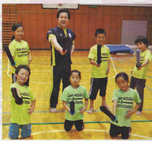
世界選手権に出場する山王台スポチャンクラブの選手たち

面や柄などの簡単な防具を身に付け、空気で膨らませた長さ60cmほどの「小太刀」や、100cmほどの「長刀」などを使い、相手の打撃をかわしながら互いに打つチャンバラ。その第41回世界選手権大会が11月1日、東京都世田谷区の駒沢オリンピック公園総合運動場内の体育館で行われる。