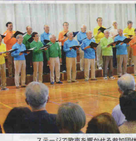
ステージで歌声を響かせる参加団体

「第31回洋光台音楽のつどい」が10月24日、洋光台小学校で開催され、周辺小学校に通う児童や地域で音楽活動を行う団体が合唱や演奏を披露した。