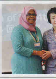
参加都市の市長と横浜市市長と握手する横浜市市長

アジアの持続可能な成長をめざし、新興国各都市の課題や取り組みについて有識者を招き議論する国際会議「第4回アジア・スマートシティ会議」が10月20日、ヨコハマグランドインターコンチネンタルホテル西区IIで行われた。主催は横浜市。