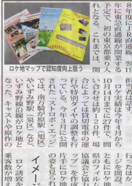
ロケ地マップで認知度向上狙う

相模鉄道は2010年以降、本格的にロケ受け入れの取り組みを始めた。主な目的は「相鉄」の認知度向上だ。同社は2018年度にJR直通線、翌19年度に東急直通線が開業する予定で、初の東京都乗り入れとなる。これまでは、関係先との連携が課題となっていた。