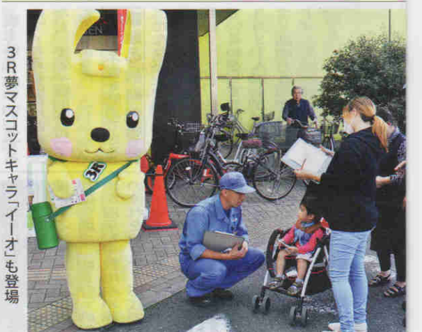
3R夢マスコットキャラクター「オ」も登場

東北の食材を使った料理 イベントなども開いている 同法人。フェアは被災地の 産業復興支援が目的。「食 べて応援しよう」をテーマ として、海産物・野菜・フルー ツ・酒・スイーツなど、食 の宝庫である東北の逸品を 展示販売する。