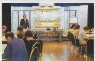
実際の祭壇を展示